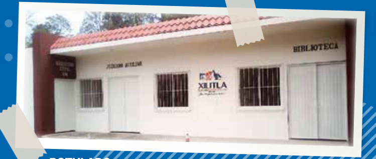
ROTULADO JUZGADO, BIBLIOTECA Y REGISTRO TLALETLA