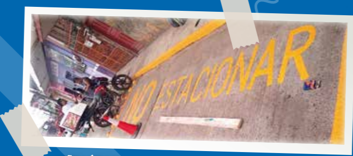
SEÑALÉTICA RUTAS DE TRANSPORTE